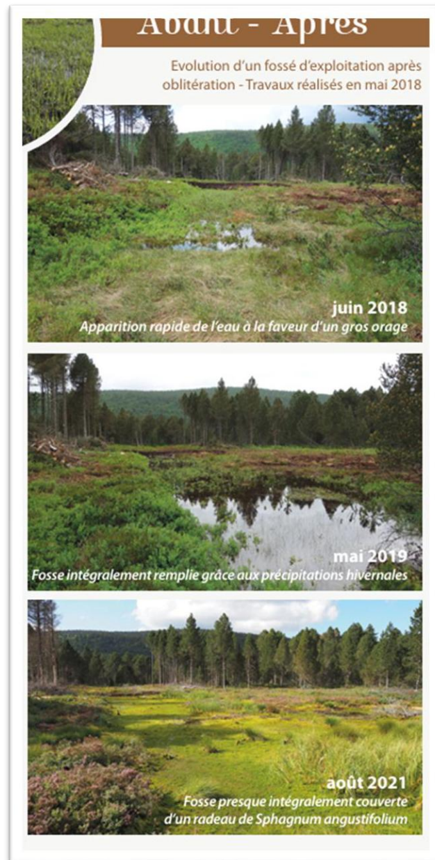
Photo 2 - Exemple de pièce d'eau libre colonisée par la végétation quelques années après les travaux de restauration (Life tourbières du Jura)