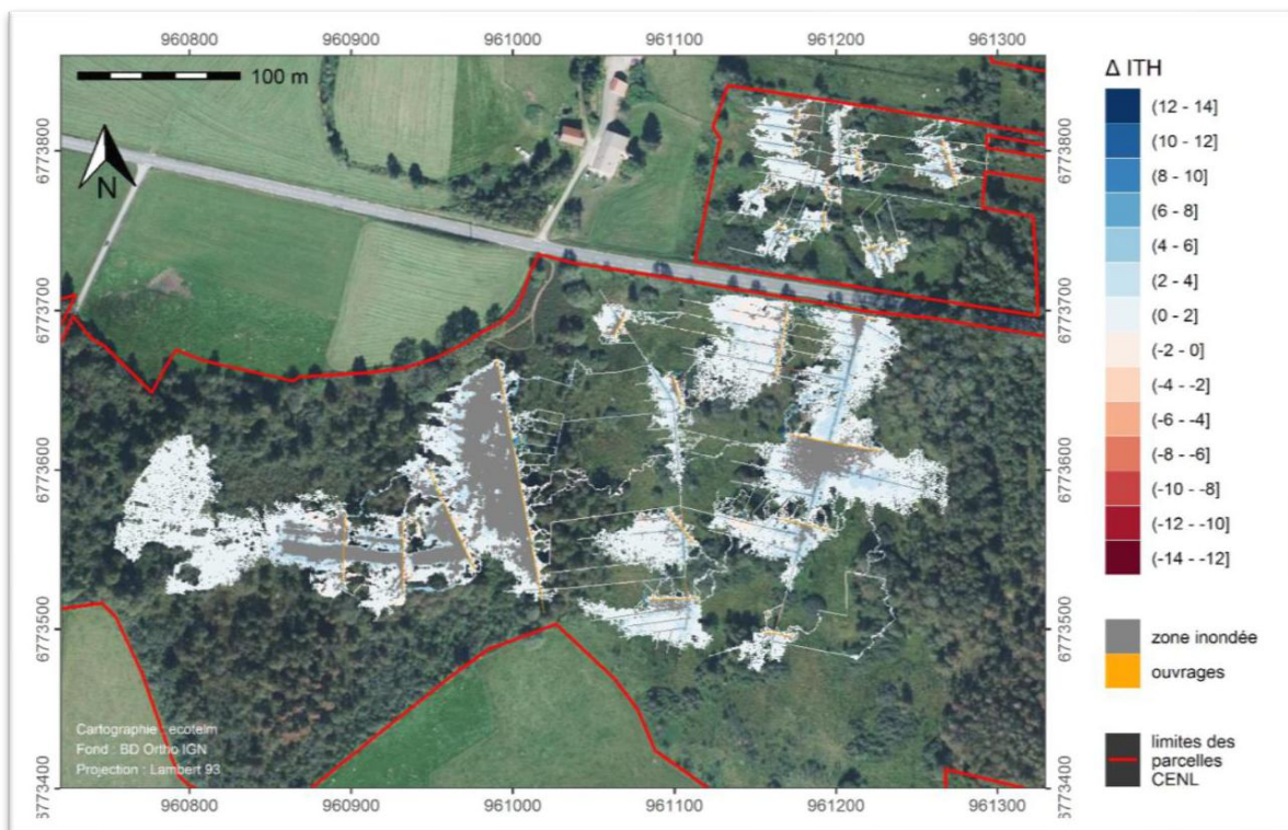
Carte 1 - modélisation de l'impact de travaux de restauration sur le niveau de nappe. Les secteurs inondés apparaissent ici en gris (© A. Duranel - Ecotelm)

Le projet de restauration doit évaluer a priori la surface sur laquelle les travaux provoquent une submersion de l'histosol (Carte 1), ainsi que les émissions de GES générées par ces surfaces afin d'évaluer si ces derniers sont significatifs par rapport aux réductions d'émissions totales du projet (évaluation de la complétude des sources d'émissions).