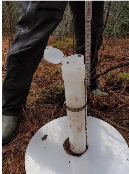
Photo 3- Mesure de la distance entre le sommet de la tige filetée et le sommet du piézomètre

Il n'est pas nécessaire, et parfois même contre-productif, de mesurer le niveau de l'eau dans le piézomètre ou la distance entre le sommet du tube et le sol immédiatement après l'installation. Il faudra laisser passer quelques semaines afin que le niveau s'équilibre avec celui de la nappe, et que le sol retrouve son niveau initial, potentiellement impacté par le piétinement lors de la pose du piézomètre.