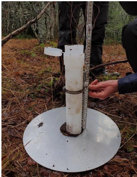
Photo 1- Mesure de la distance entre le niveau du sol et le sommet du piézomètre

Dans les secteurs avec touradons, on pourra éventuellement en couper quelques-uns à la base avec une scie égoïne pour aplanir le terrain, à condition que cette opération enlève l'essentiel de la masse vivante.